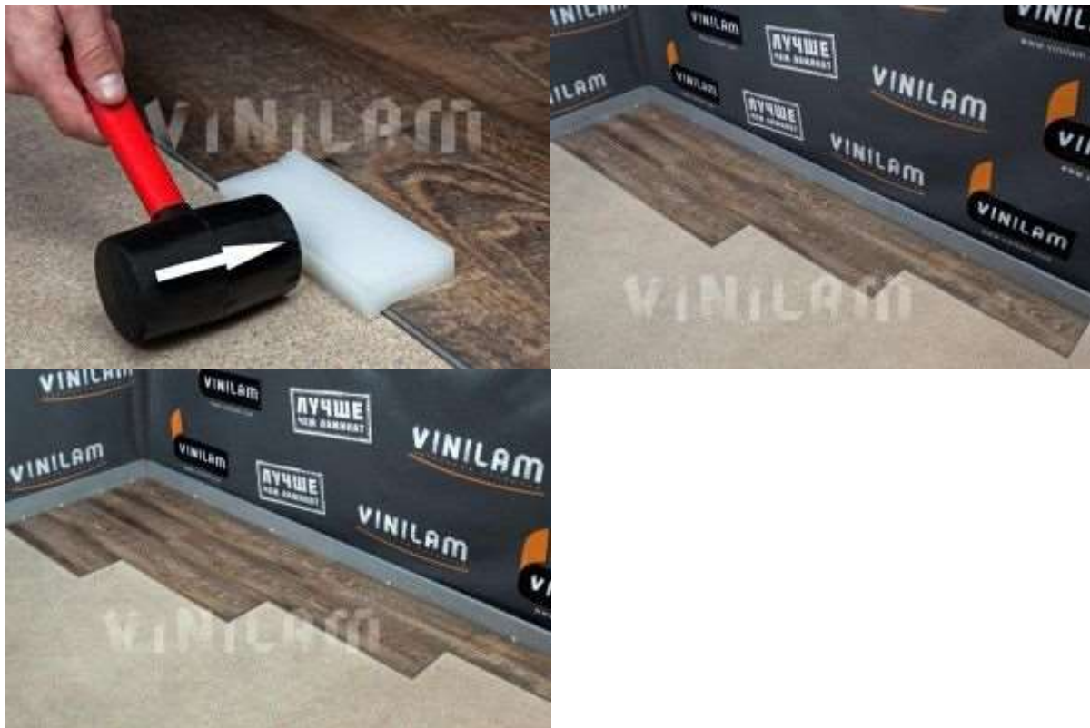
Фото 16. Фото 17. Фото 18.

После укладки каждой планки, и после укладки каждого ряда, обязательно нужно сделать подбивку всех планок. (Подбивную пластину Вы можете заранее купить, либо взять у наших диллеров на время укладки).