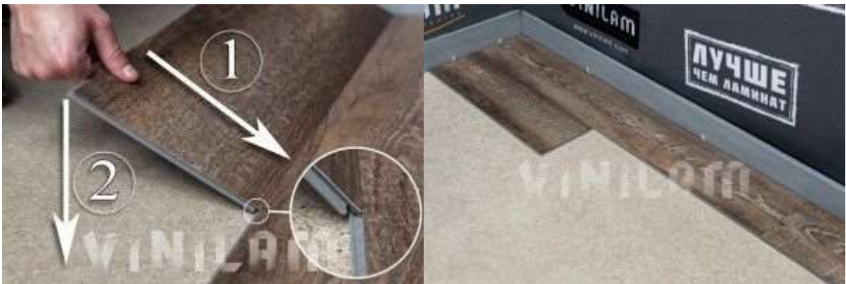
Фото 11. Фото 12.

4. Потом берем целую планку, защелкиваем ее сначала по поперечному замку.