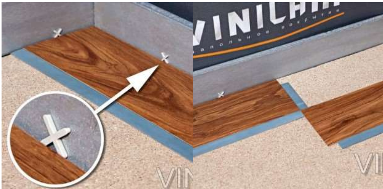
Фото 18. Фото 19.