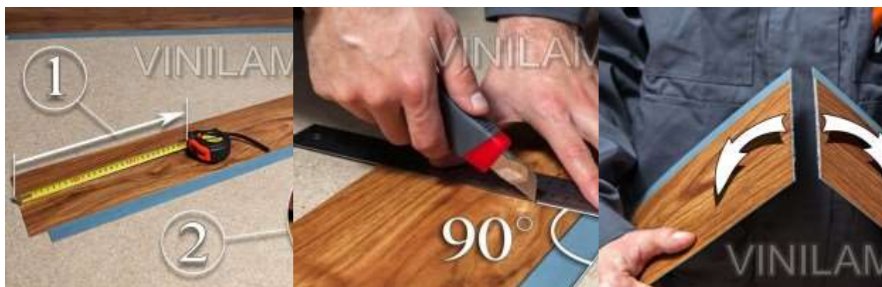
Фото 6. Фото 7. Фото 8.

Берем ту половинку, на которой выступает нижняя часть планки и клеевая лента «смотрит» вверх Г-образно. Отрезанным краем укладываем к стенке, оставляя зазор 3–5 мм. Приклеиваем по продольной части «SMART-Ленты» – сначала так, чтобы верхние кромки соприкоснулись боковыми поверхностями. При этом прилагаем небольшое боковое усилие – от планки которую приклеиваем, к планке на которую приклеиваем. И только после этого прилагаем усилие сверху вниз, склеивая клеевую «SMART-Ленту». Фото 9, Фото 10.