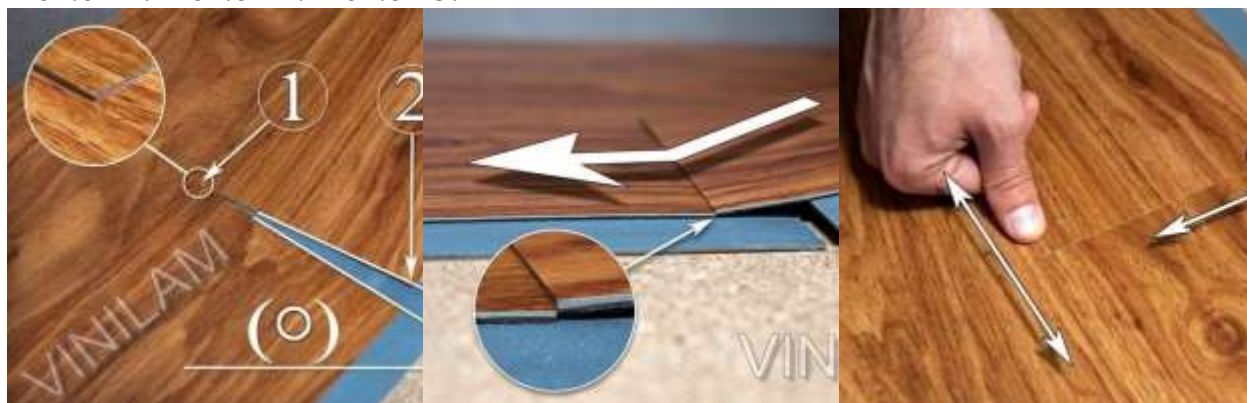
Фото 11. Фото 12. Фото 13.