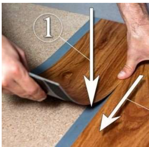
Фото 9. Фото 10.

После приклеивания по продольному шву, по месту стыковки, нужно пройтись прикаточным роликом или же хорошо потоптаться ногами, воздействуя на него весом всего тела.