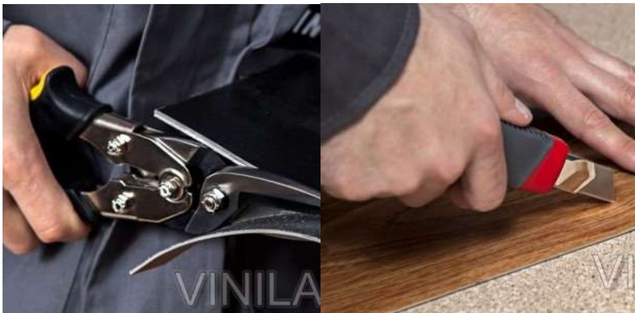
Фото 20. Фото 21.

Если же этого не хватает, укладку первого ряда вообще начинают с планок, разрезанных вдоль по всей длине напополам. Фото 22, Фото 23, Фото 24, Фото 25.